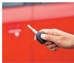
Llave inalámbrica con inmovilizador

Un tomacorriente de 12 V está convenientemente ubicado y puede ser utilizado para cargar teléfonos u otros dispositivos electrónicos.