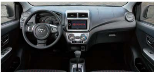
Tablero de instrumentos