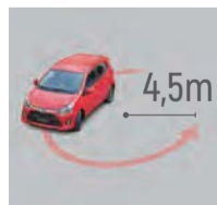
Radio mínimo de viraje

El uso de un motor con VVT-i ayuda proporcionar un balance entre poderosa aceleración y economía de combustible que lidera su segmento.