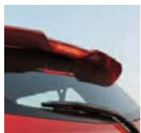
Tercera luz de freno

Bolsas de aire tipo SRS para el conductor y pasajero delantero incrementan su paz mental.