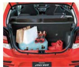
Espacio de carga

Nuevos rines de aluminio pulido de 14 pulgadas le dan una apariencia lujosa al Agya.