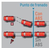
Frenos Antibloqueo (ABS)

Una luz de freno incorporada en el spoiler trasero, mejora la visibilidad para los conductores que vienen detrás del Agya.