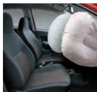
Bolsas de Aire SR

El pequeño radio de viraje le da al Agya una fuerte ventaja sobre sus competidores y una maniobrabilidad extraordinaria.